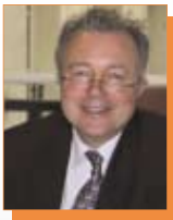
Patrice Michel LANGLUME Président de l'ESA